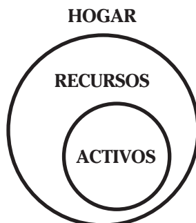
Figura 2: Recursos y activos