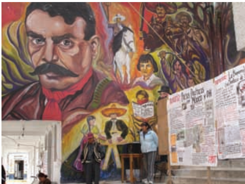
México, Atenco.