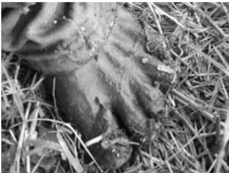
Guatemala. Autor: Bernardo Fernandes Mancano