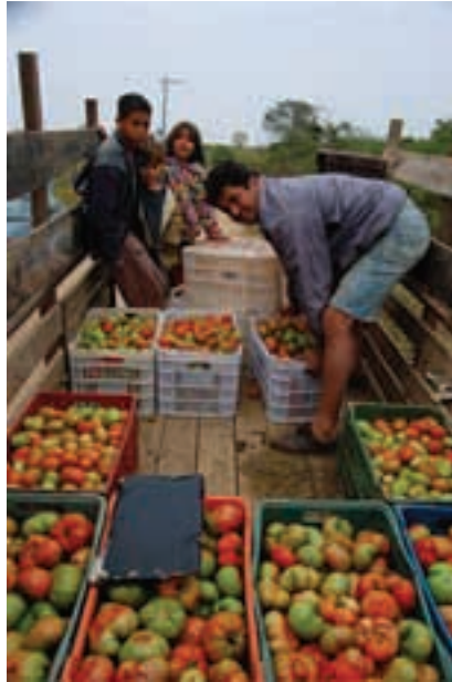
Brasil. Assentamento Ipanema.