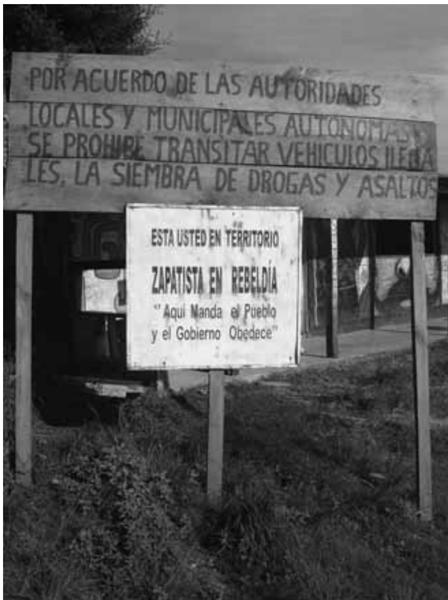
México, Chiapas, Oventik. Autora: Luciana García Guerreiro