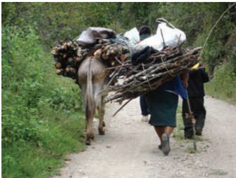
México, Oaxaca, Yavesía.