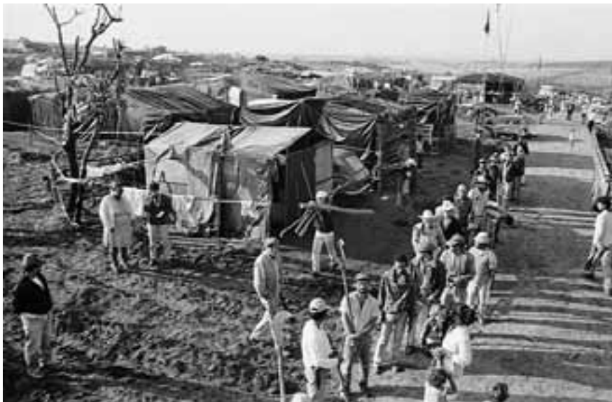
Brasil - Acampamento de Ipero II. Autor: Douglas Mansur).jpg