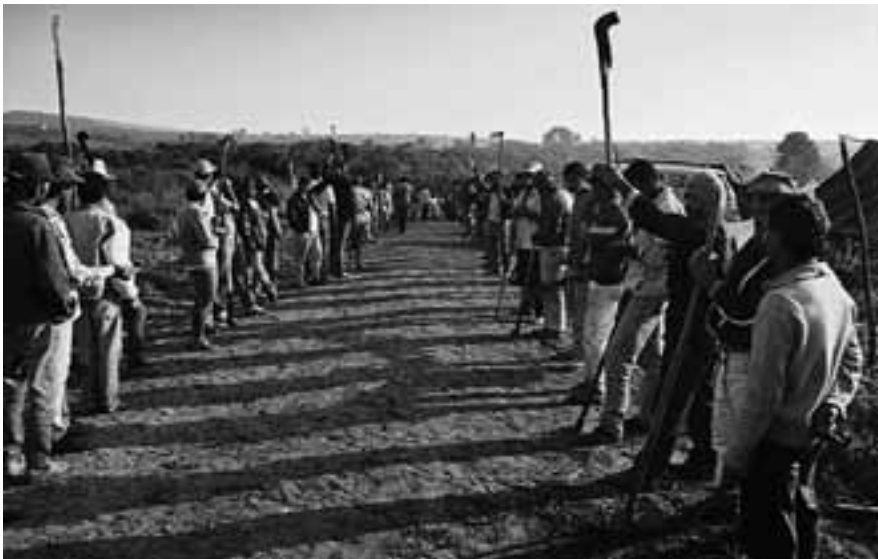
Brasil - Acampamento de Ipero. Autor: Douglas Mansur

BMF: Aquí yo puedo ofrecer una información. Nosotros acabamos de terminar una investigación basada en datos, pasados en confianza, de la Auditoría Agraria Nacional (AAN) y de la Comisión Pastoral de la Tierra (CPT). La CPT y la AAN siempre han registrado las ocupaciones y los asentamientos, y siempre hay una disputa de números en cuanto a la cantidad de asentamientos que hubo. Yo pedí los datos de ocupación por ocupación y los crucé uno por uno. El 40% de los datos registrados por la AAN, la CPT no los tenía registrados. Y el 40% de los datos de la CPT, la AAN, no los había registrado. Coincidían, más o menos, en la mitad. El resto, cada uno tenía un dato que el otro no había conseguido. Cuando se confrontaba todo, yo tomé los datos de ambas organizaciones para el período 1995 /2005, la CPT registró 600.000 familias ocupando tierras y la AAN registró que hubo 480.000 familias ocupando tierras. Cuando se confrontan los datos, se llega a la cifra de que 900.000 familias ocuparon tierras en esos 10 años. Todos los estudios se hicieron siempre con datos parciales nunca con datos completos. Y con respecto a los asentamientos, el gobierno de Lula tiene una característica interesante, diferente al gobierno FHC. El gobierno de FHC desapropió mucho más que Lula, sólo que con Lula, si bien el número de familias asentadas es menor, el área es casi el doble.