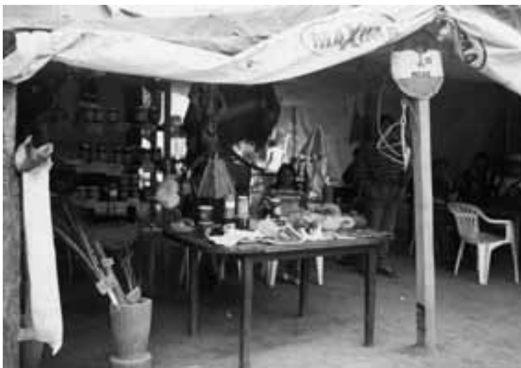
Argentina. Feria Mailin. MOCASE.