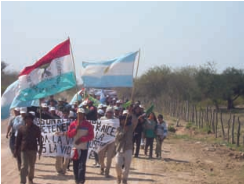
Argentina. MOCASE VC. Foto de FANA