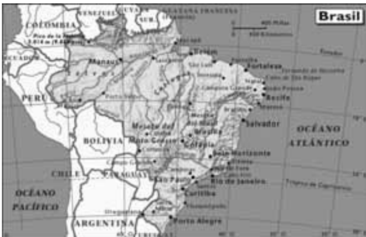
Mapa de Brasil