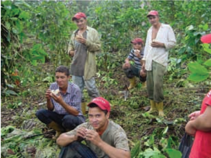
Venezuela, Chavasquen.