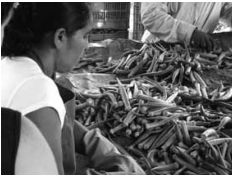
Guatemala. Autor: Bernardo Fernandes Mancano