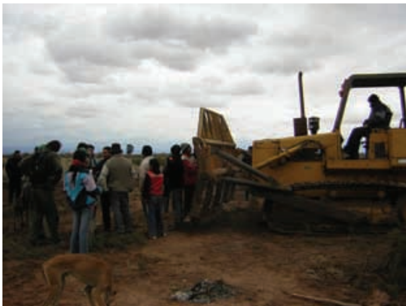
Argentina. UST.