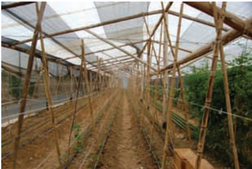
Brasil. Assentamento Ipanema.