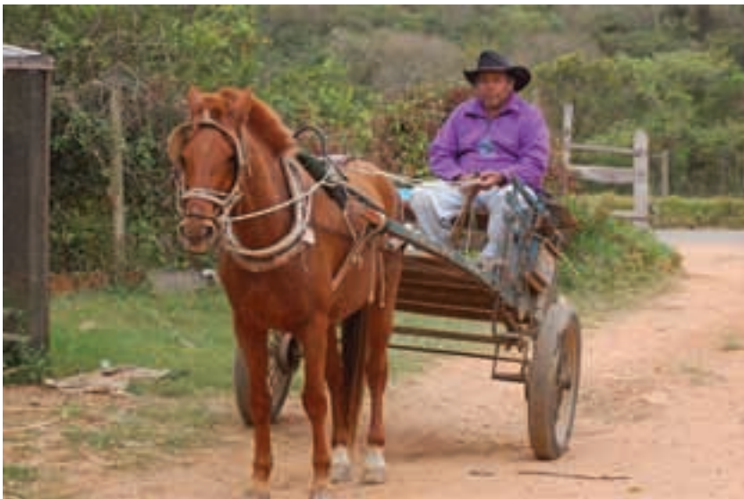
Brasil. Assentamento Ipanema. Foto de Douglas Mansur