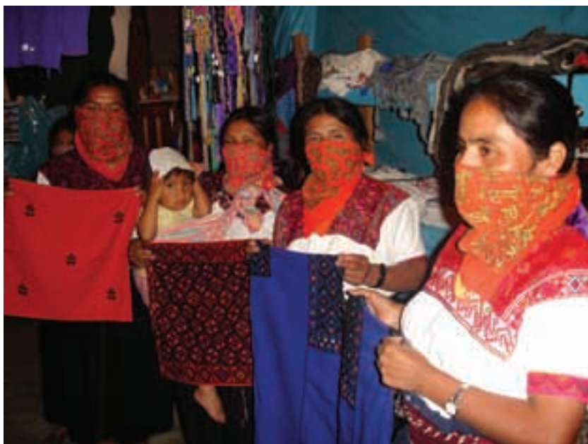
México - EZLN.