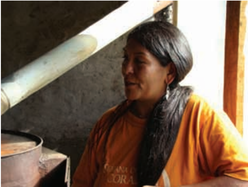
Argentina. Comunidad Mapuche.