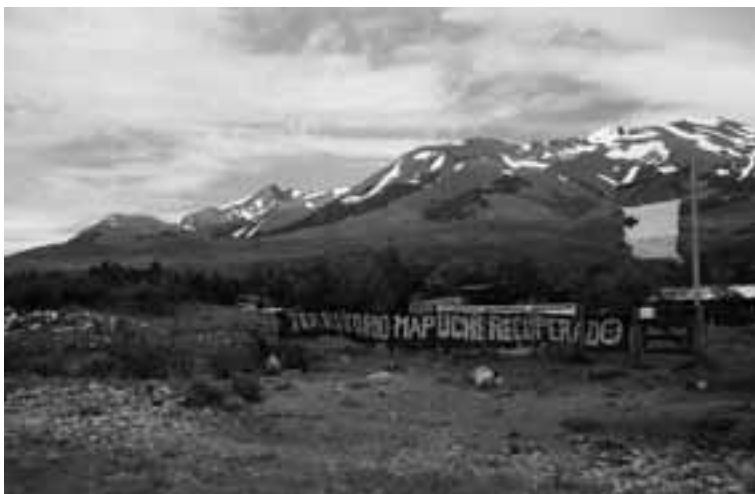
Argentina. Comunidad Mapuche.

reunión con ellos. En realidad, la mayoría de las veces nos comíamos el curanto nosotros durante toda la semana porque venía muy poca gente y nosotros igual hacíamos. Eso nos pasó durante dos veranos seguidos ya. Nosotros tenemos esperanza que este verano sea diferente. . .