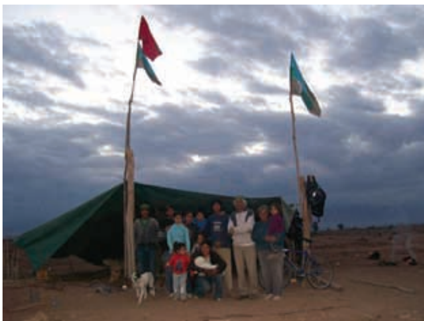
Argentina. UST II.