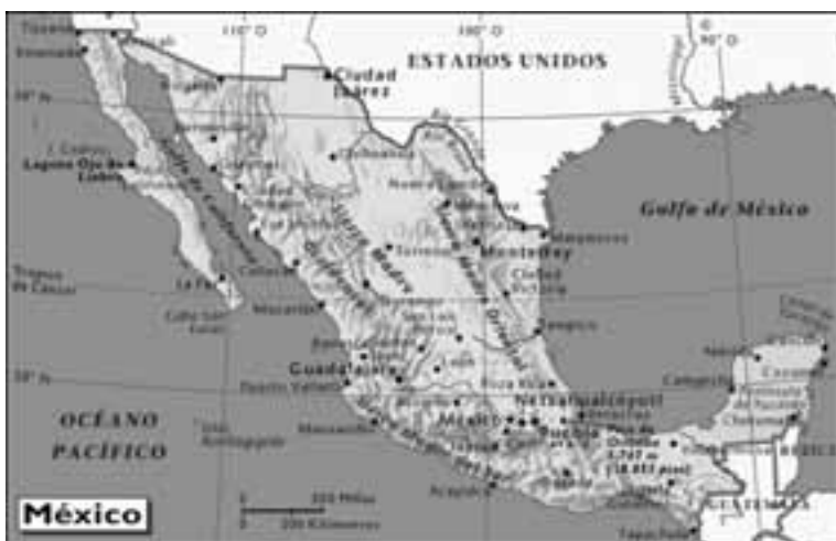
Mapa de Mexico