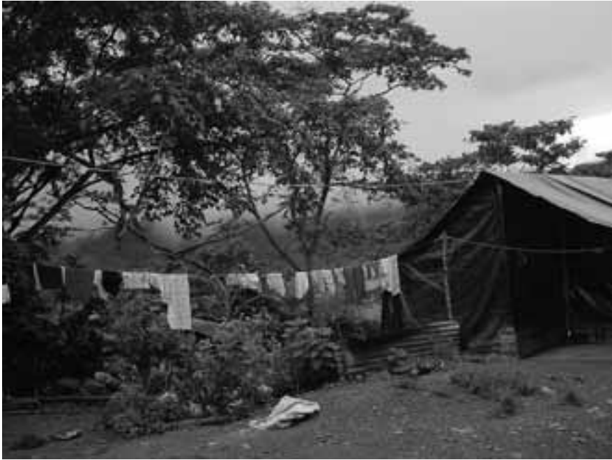
Venezuela, Chavasquen. Autora: Celeste Castro García