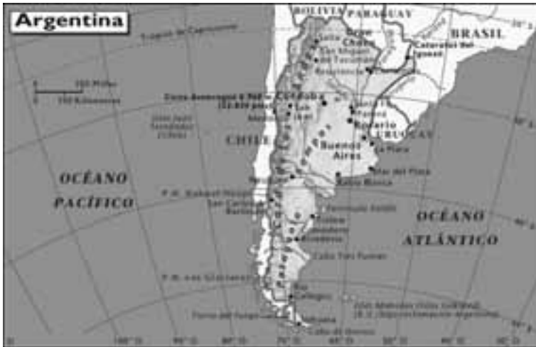
Mapa de Argentina