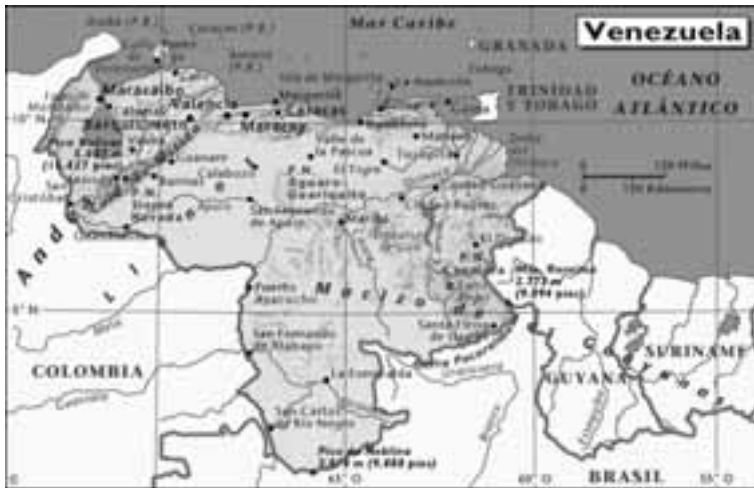
Mapa de Venezuela