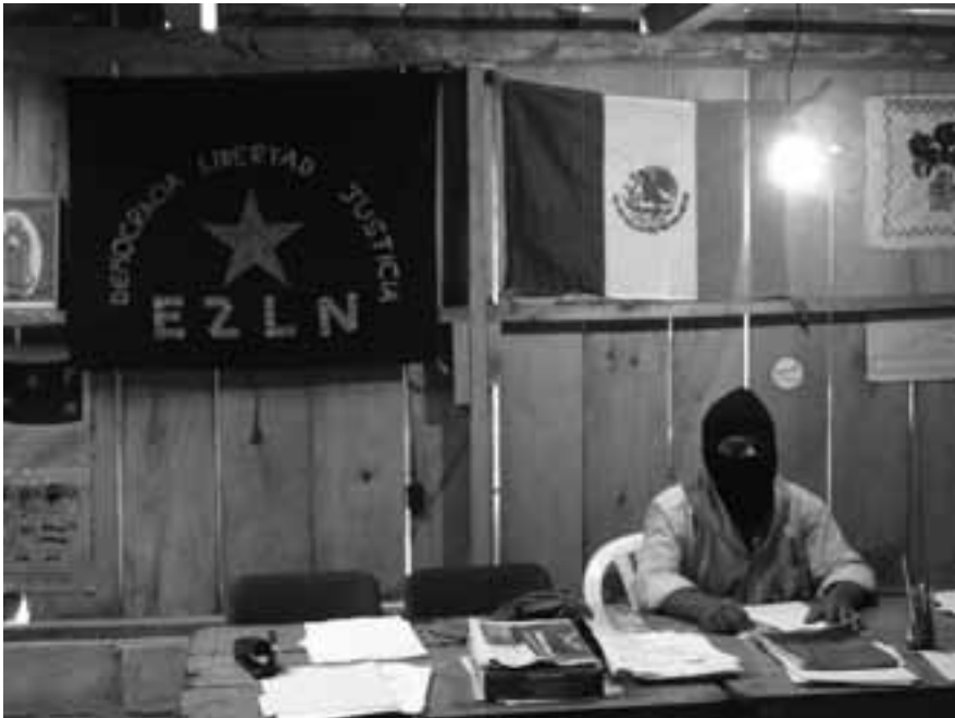
México, Chiapas, Oventik. Autora: Luciana García Guerreiro

sino lo que nos da la tierra y mi gusto es eso, estar con el movimiento, luchar por mis compañeros y darles de comer, eso es mi emoción. Porque siempre vamos a defender la tierra y defender al pueblo. Y, a base de tanta constancia, yo les enseñaba a otros compañeros a decir consignas, a que gritaran y ahí ya la gente se fue enseñando a gritar, a decir las consignas, a no dejarse y ahí aprendí yo. Yo aprendí mucho, mucho del movimiento. Incluso aprendí a defenderme de mi propio esposo, aprendí a defenderme del gobierno, aprendí a no tenerle miedo al gobierno, aprendí a defenderme por sí sola y ayudarle también a la gente a que se defendiera, porque ya no nos íbamos a quedar callados. Anteriormente éramos sumisas, éramos hasta maltratadas por los hombres; ahora ya no, ya no maltratamos, yo aprendí mucho. Le debo mucho al movimiento porque aprendí muchas cosas, que la mujer valemos tanto o más que el otro. Hasta aprendimos a hablar, porque no sabíamos hablar, nos daba pena hablar, nos daba pena decir algo, ya no. Aprendimos a defendernos. Ahora, no nomás, hablamos, gritamos y la lucha sigue. . .