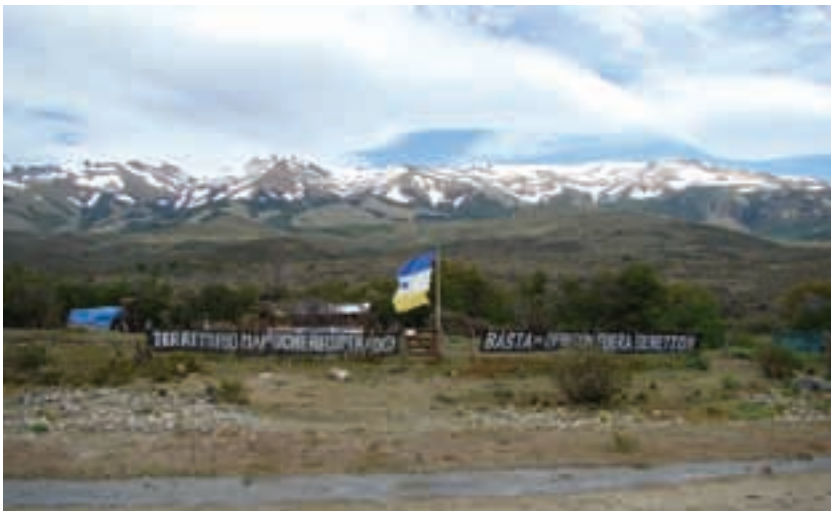
Argentina. Comunidad Mapuche.