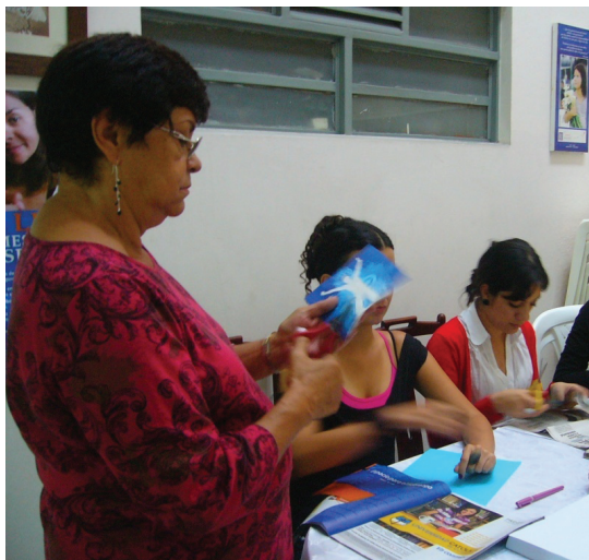
Foto 2: Construyendo el presente. Casa de la Mujer de Pereira, 2010

Joven, juventud y relaciones inter-generacionales son categorías que en el presente texto se asumen trascendiendo un sentido cronológico en