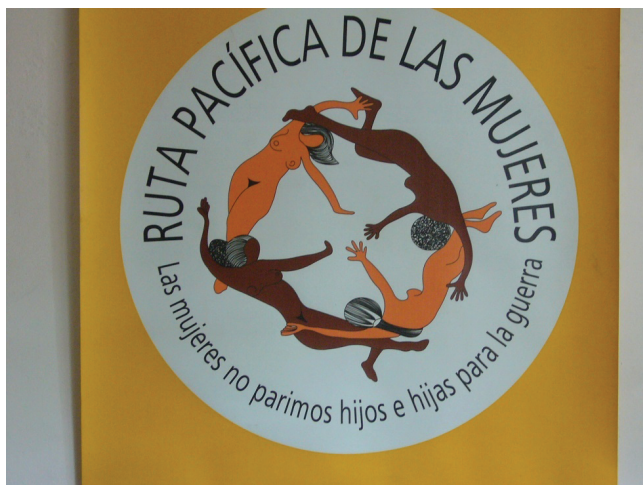
Foto 3: Afiche con consigna significativa de la Ruta Pacífica de las Mujeres