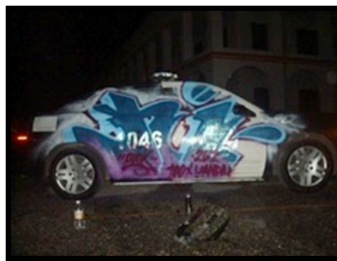
Imagen 2. Graffiti clandestino - H.I. Crew, 2012. Fotografías de Punker.

[...] mientras el ilegal está lleno de adrenalina y emoción y salir victorioso es lo más importante, la pinta legal es más compleja y el graffitero siente mucha presión de hacer un buen trabajo, combinado con mucho orgullo cuando la gente ve tu pieza terminada (Speck, comunicación personal, 2011).