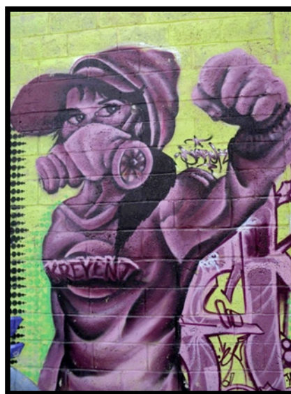
Imagen 4. Graffiti elaborado por Darek, 2010.

Los significados y sentidos en las “pintas” o “piezas” también se multiplican. Las obras de algunos graffiteros y una graffitera que colaboraron en la investigación, pueden servir para ejemplificar dicha diversidad. Darek, una de las primeras mujeres que participan en la escena del graffiti local (Véanse imágenes 4 y 5) expresa algunas características de sus obras y el sentido que le otorga a estas: