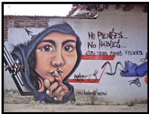
Imagen 8. Graffiti elaborado por Orbe. N. S. K. Crew.