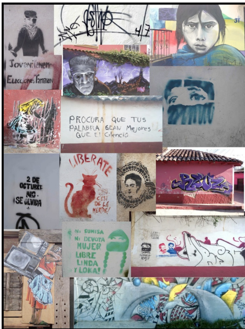
Imagen 1. Diversidad de producciones visuales callejeras en San Cristóbal de Las Casas.

años para la expansión del movimiento, como también ha sido importante el papel las industrias culturales, las cuales han integrado al graffiti a un amplio mercado comercial que ofrece una amplia gama de productos para pintar, producciones audiovisuales, prendas de vestir y publicidad comercial (Valenzuela, 1997) para quienes desean incursionar en dicha práctica. Como sucede con otras expresiones juveniles, las industrias culturales han ayudado a popularizar la práctica del graffiti entre las y los jóvenes por medio del mercado juvenil, pero también han resignificado su práctica y sus contenidos.