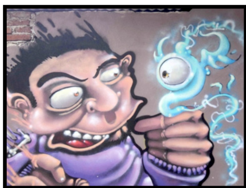
Imagen 9. Graffiti elaborado por Orbe, N.S.K. Crew.

Trato, por otro lado, se inclina por la realización de piezas cuyo contenido son principalmente rostros, caracteres y realismo, realizando ocasionalmente graffiti ilegal. Para este autor sus piezas tienen muchos simbolismos que evocan la memoria, la muerte, sus amigos y el barrio (Véase Imágenes 10 y 11).