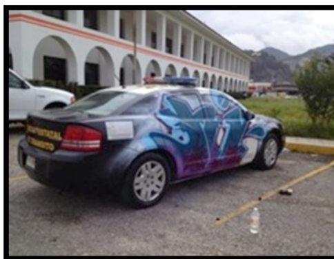
Imagen 3. Graffiti clandestino - H.I. Crew, 2012. Fotografía que circuló por Internet.