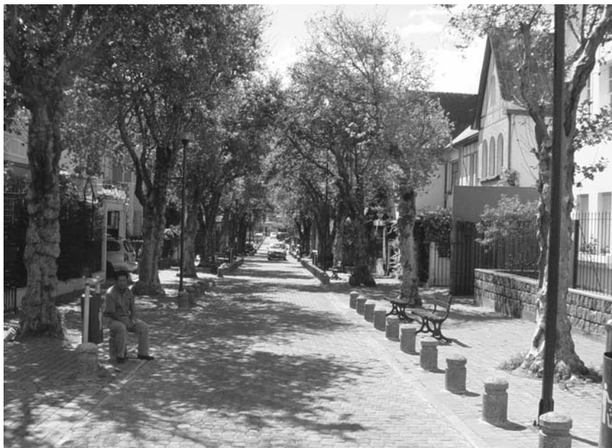
Calama y 6 de diciembre

Los elementos de este texto sobre espacio público son para la reflexión. Es importante que exista una política municipal sobre espacio público como algo prioritario, que establezca el marco político sobre el uso del espacio publico y poner freno al abuso del mismo.