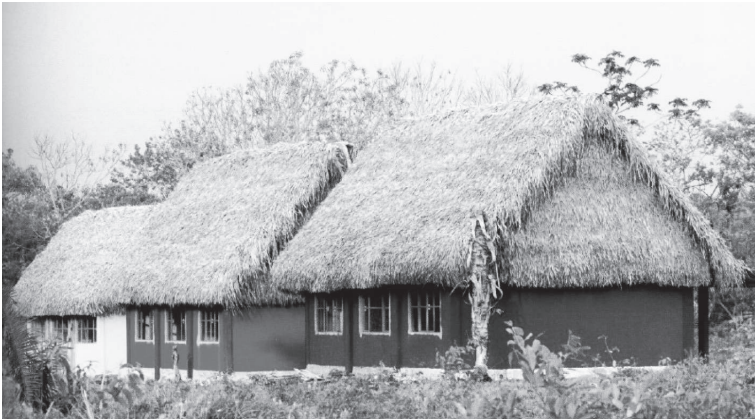
Imagen 1. Universidad Indígena Intercultural Ayuuk, Oaxaca, 2007-2008

Fuente: Bitácora Arquitectura , 2009, núm. 19. Recuperado de: http://www.revistas.unam.mx/index.php/bitacora/article/view/25114