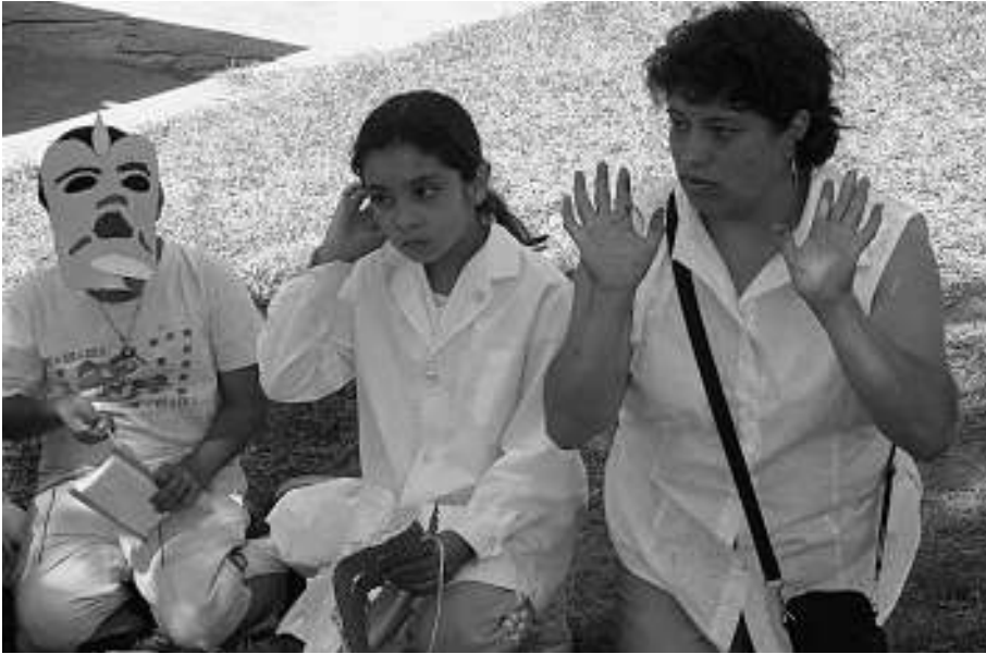
2. Taller para la elaboración de máscaras en la escuela rural

cante del evento ya que, a partir del mismo, la escuela se constituyó en un centro convergente de interacción social. Asistieron padres, abuelos y personas no vinculadas familiarmente con los alumnos. Instalado el tema de la significación del acervo cultural en el lugar, los discursos de las personas mayores expresaban su agradecimiento por sentirse valoradas. Al decir “nuestras cosas”, y a pesar de no destacarlas, inferimos un significativo sentido de pertenencia hacia aquel contexto y su antigua impronta. Interpretamos que dichas expresiones reprimidas, en términos del hablar cotidiano, eran secuelas del repetido proceso de auto-subestimación del nativo con respecto a su patrimonio cultural.