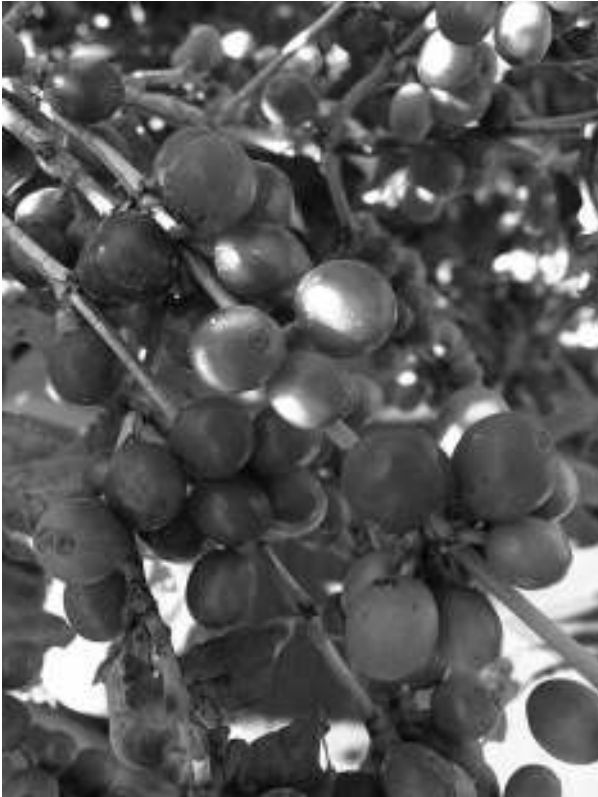
2. Huerto de café

tituye la vegetación original por especies arbóreas de sombra, con menos variedad que en el anterior manejo. Se practica también el monocultivo bajo sombra, que emplea una sola especie protectora; y el monocultivo a sol, con arbustos de rápida maduración, corta vida, baja talla y alta densidad; sin embargo estos últimos sistemas son más perjudiciales para el medio ambiente, ya que utilizan más agroquímicos y deterioran a mayor velocidad la tierra de cultivo.