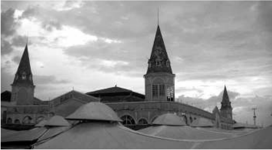
Detalles de las tiendas

vista Caras 1 la escogiera como una de las Siete Maravillas de Brasil. Su efervescencia máxima, tanto desde el punto de vista comercial como cultural, es en el mes de junio, cuando se celebran las fiestas de san Juan y las personas acuden al lugar en busca de hierbas para el tradicional baño de san Juan. 2 Lo mismo ocurre en el mes de octubre, cuando se celebra la fiesta del Cirio de Nazaré. 3 En esa ocasión los ingredientes más buscados son hojas de yucas, pomarrosas, patos, ya que forman parte de la preparación del almuerzo tradicional del segundo domingo de octubre.