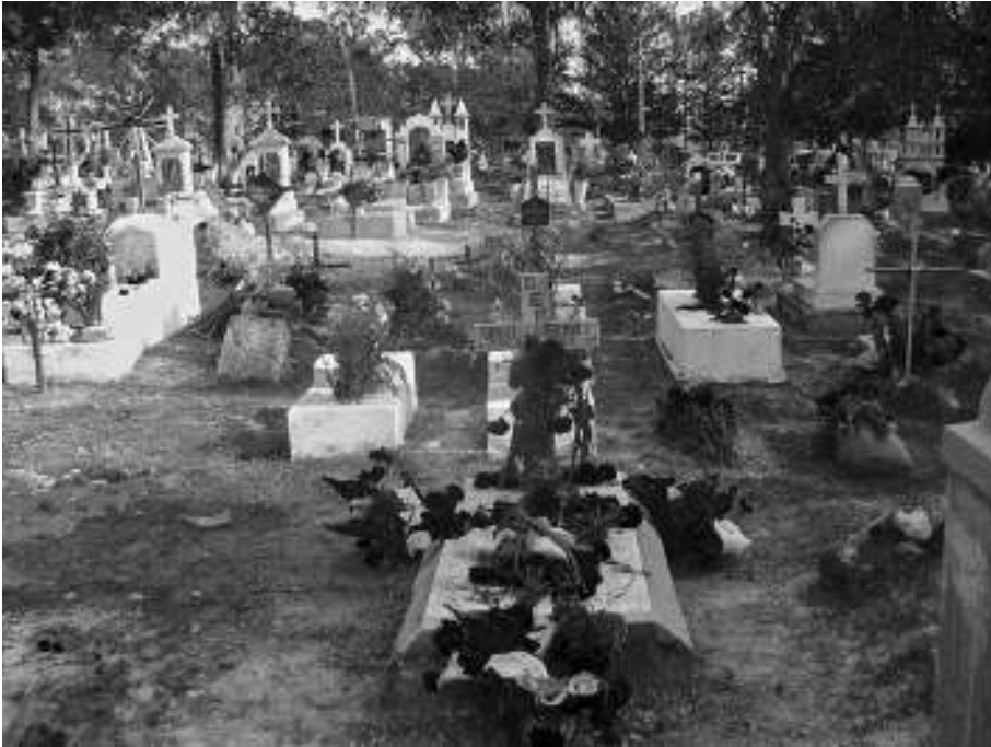
3. Visita al panteón municipal de Santa Catarina Tayata durante el Día de los Tamales

Este mismo día también se visitan las tumbas de los difuntos en el panteón municipal: se barre, se limpia, se colocan flores en las lápidas, que pueden ser las que se colocaron en la ofrenda, o bien flores del campo que se recolectan antes de ir a hacer la visita a las tumbas de los difuntos. No se observó que las personas comieran en el panteón ni que dejaran alimentos en las tumbas; tampoco que la gente intercambiara en ese espacio alimentos de ningún tipo. Como resultado de la visita al panteón, las tumbas pueden lucir como en la foto 3.