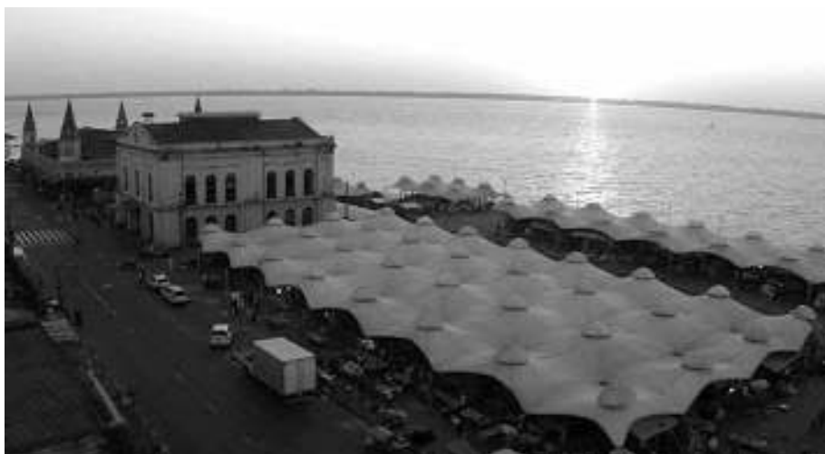
Vista aérea de Ver-o-Peso: las tiendas y la bahía de Guajará

Hoy en día, el comercio y los servicios ofrecidos en Ver-o-Peso se distribuyen espacialmente por afinidad, disponiendo de más de veinte bloques o sectores de actividades. Algunas se realizan en espacios edificados y/o delimitados claramente por demarcaciones físicas, como por ejemplo la Feria del Asaí, el muelle de Ver-o-Peso, el Mercado de Peces, el Mercado de Carne y la Piedra del Pez, además de los establecimientos de comercio y servicios ubicados en la avenida Castilho França. Otros sectores se delimitan en la práctica a través de acuerdos formales e informales entre los usuarios e interlocutores del poder público, sin que existan parámetros edificados que los separen físicamente, conformando así un territorio contiguo ocupado, independientemente del tipo de actividad que allí se realiza. Éste es el caso de los sectores de hortalizas y frutas, yerbas, camarón seco, productos de almacén, productos típicos (diferentes tipos de mandioca, pomarrosa, salsa de yuca, pimentas), animales vivos, comida, productos industrializados, artesanía y pulpas de fruta. También se desempeñan actividades de ventas ambulantes llevadas a cabo por algunos vendedores, manicuras, anotadores de apuestas de juego que van y vienen por toda el área de Ver-o-Peso, sin quedarse fijos en puntos o sectores específicos.