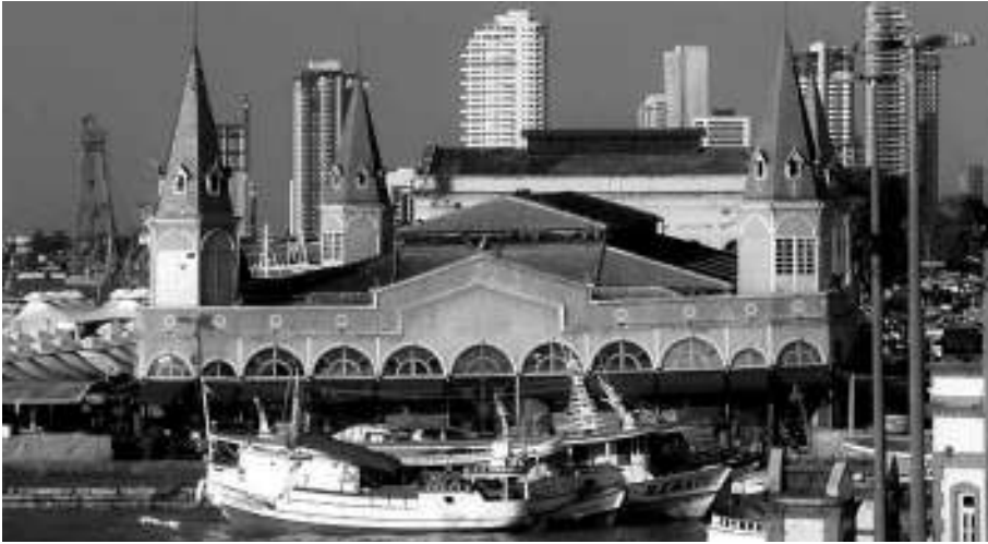
Ver-o-Peso, paisaje de Belém

Hoy día constituye un rico conjunto arquitectónico compuesto por edificaciones de alto valor patrimonial, reconocido por el Instituto do Patrimônio Histórico e Artístico Nacional (Iphan) desde 1977. El mismo representa también un espacio de intercambio comercial y simbólico entre ribereños extractores, pescadores, productores rurales, artesanos y otros, de modo que resume y actualiza aspectos centrales de la identidad del estado de Pará. Es un lugar de preservación y transmisión de conocimientos tradicionales asociados con prácticas de alimentación, medicina, artesanía, así como con maneras de hacer y vivir que componen el vasto sistema cultural amazónico.