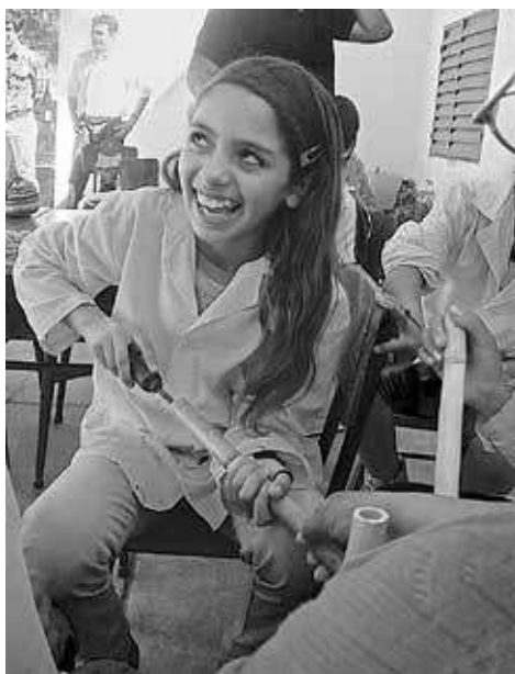
5. Taller para la construcción de flautas en la escuela rural