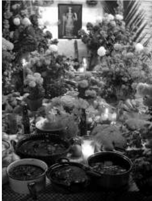
2. Ofrenda de la familia Pacheco Bautista para el Día del Mole