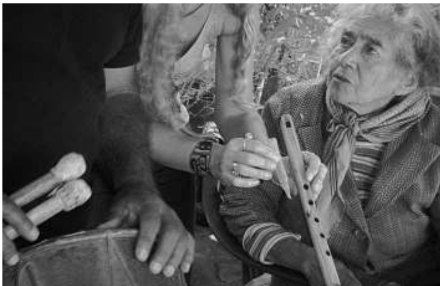
6. Registro de melodías y ritmos antiguos