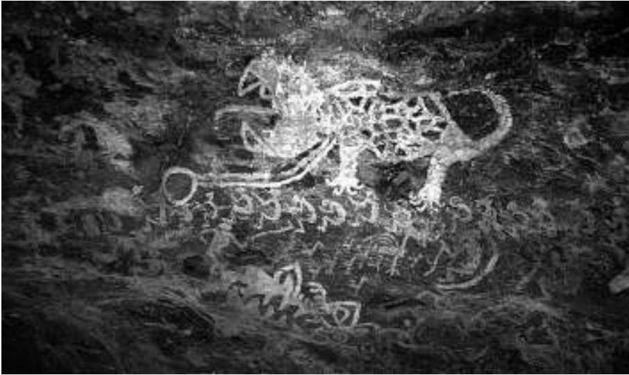
1. Escena de la danza del agua. Pictogramas de La Cueva

Con la finalidad de descubrir, en el imaginario social, vestigios de una supuesta herencia de tradición ritual, se implementaron visitas a La Cueva junto con los habitantes del lugar. Allí se relataron historias de la cosmogonía diaguíta, extraídas de fuentes inéditas. En ese lugar y posteriormente en la escuela, se realizaron transferencias con expresiones en artes plásticas y debates, como estrategias de acercamiento al universo sagrado ancestral.