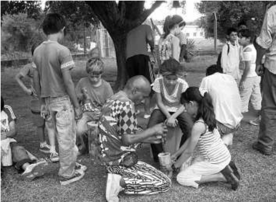
3 y 4. Taller para la construcción de cajas en la escuela rural