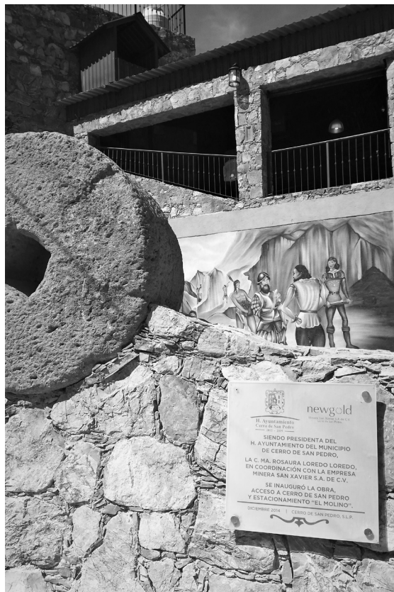
Archivo personal (marzo de 2018).

reterritorializarse para sobrevivir, mientras enfermó, luchó, murió, y mientras las generaciones posteriores o quienes se quedaron, fueron olvidados, negados y despojados.