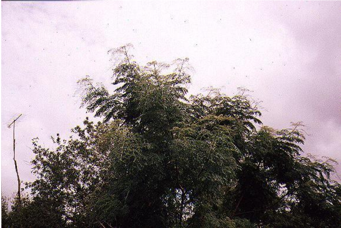
Foto 34 – El tallo y el pecíolo de algunas hojas, doblados en el sentido de la deriva. Otros pecíolos, doblados hacia abajo.