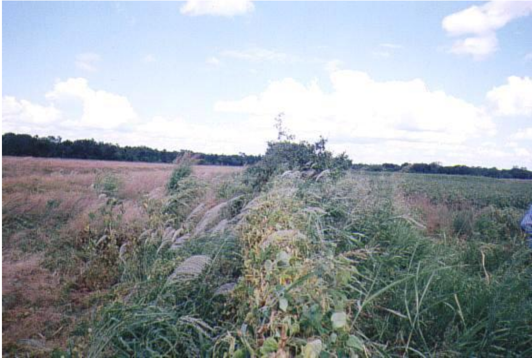
Foto 2 – A la izquierda, se aplicó herbicida. A la derecha, lote de un pequeño productor.

Foto 1 – En el lote de la izquierda se aplicó herbicida. El lote de la derecha resultó afectado. Las plantas dan idea de la dirección e intensidad del viento.