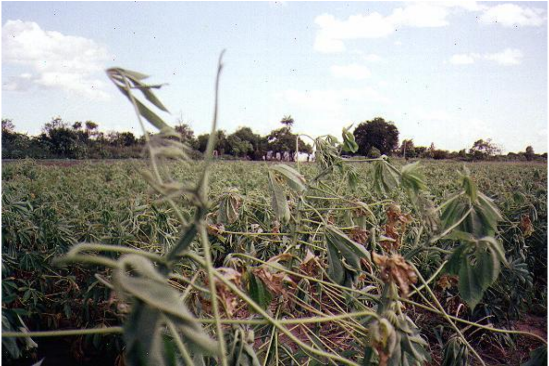
Foto 12. Hojas quemadas. Efecto del glifosato