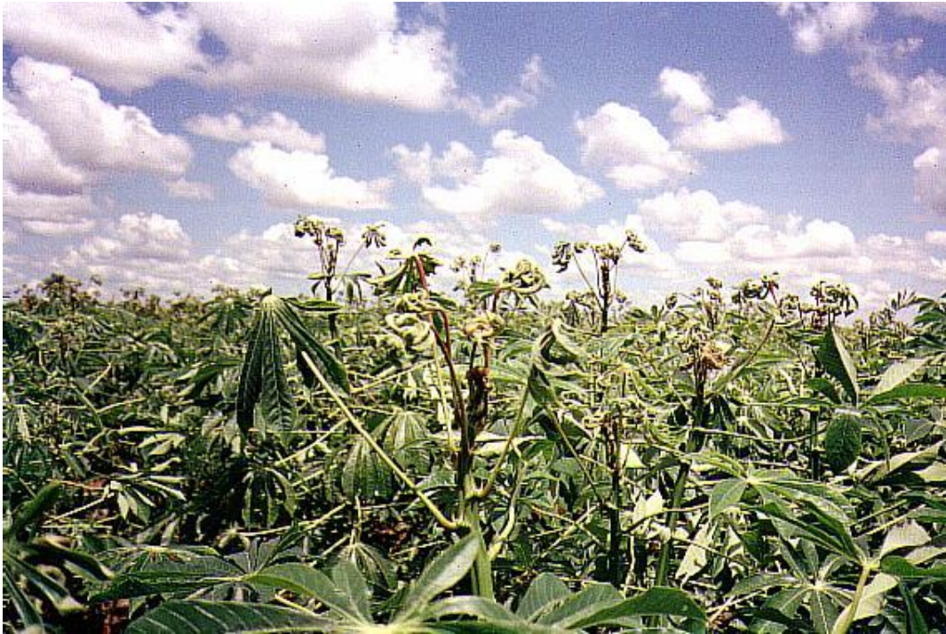
Foto 8. Detalle del ápice afectado por 2,4 D. Se puede notar la deformación de las hojas nuevas comparándolas con las hojas maduras