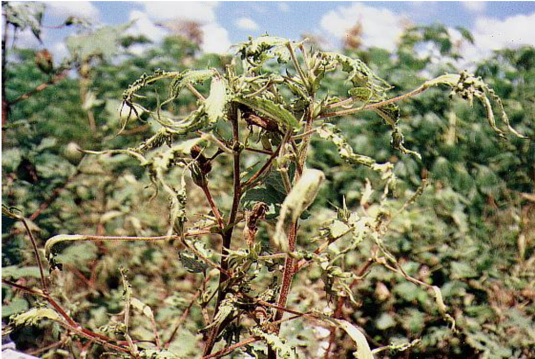
Foto 4. Algodón: perillas secas que cayeron con la primera lluvia