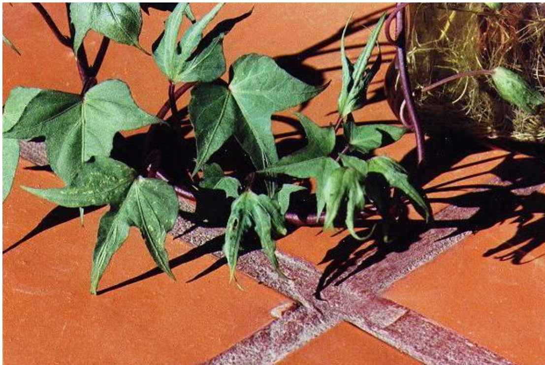
Foto 40. Las hojas de la segunda mitad del brote (la parte superior), si bien se aproximan en tamaño y forma a hojas normales, aún muestran los síntomas del exceso de auxinas derivado del 2,4 D que recibió la planta.