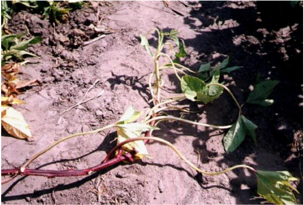
Foto 22 – Las hojas se “acuestan” y se forman “claros” en la plantación