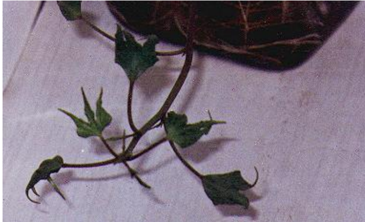
Foto 38. Se observa que las primeras hojas (en la parte inferior) son muy pequeñas y deformadas. Completamente anormales. El tamaño y forma de las hojas más nuevas, se aproxima más a una hoja normal de esta variedad.