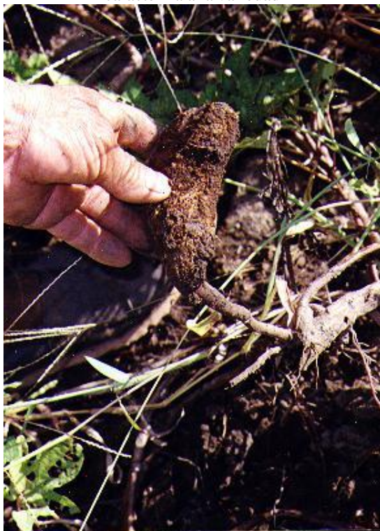
Foto 25 – Aún se ven restos de la piel rosada y lisa que caracteriza a la variedad