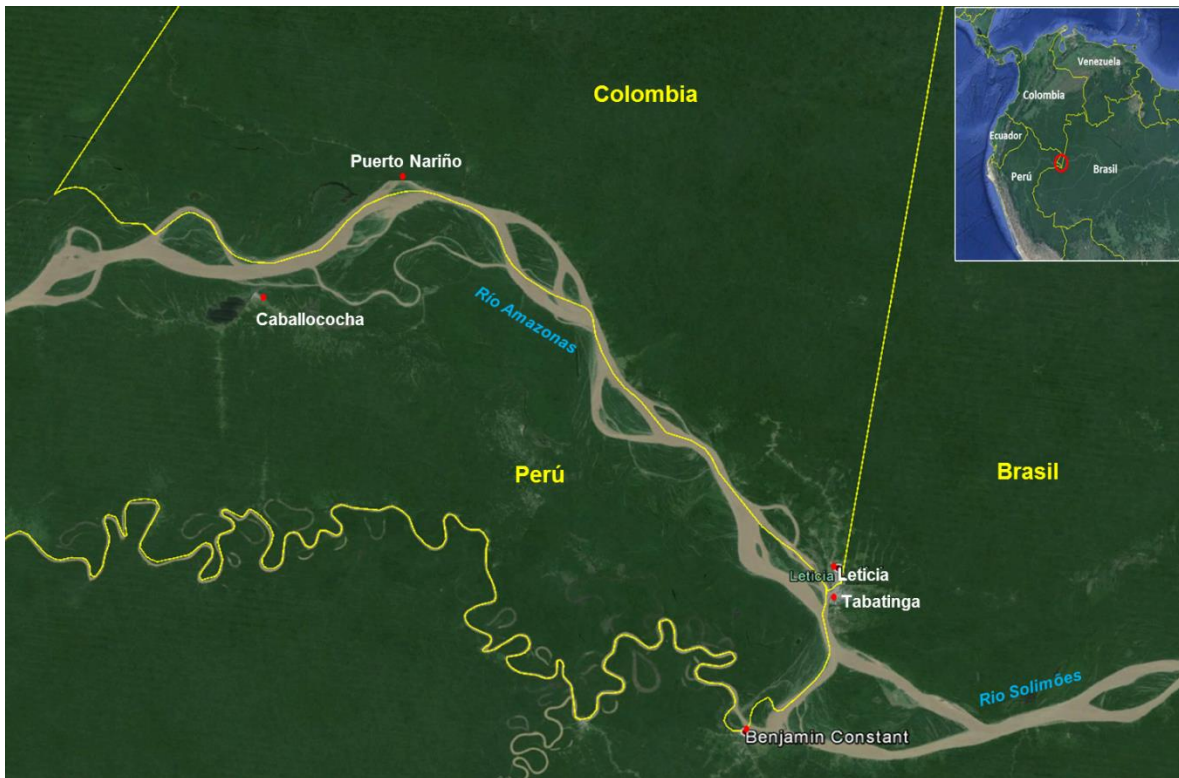
Figura 1. Ubicación geográfica de la región fronteriza.