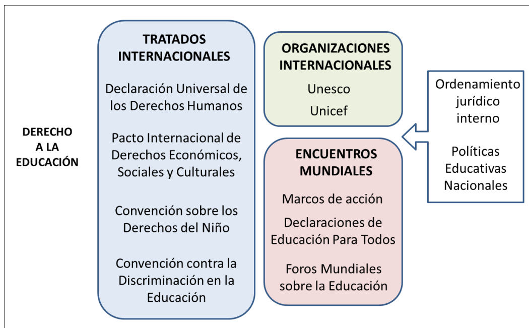
Esquema 1. Principales fuentes y mecanismos del derecho a la educación.

participación de casi todos los países del mundo. Todo ese sustento del derecho internacional se ve reflejado en el ordenamiento jurídico interno de cada Estado a partir de sus constituciones nacionales, así como en las diferentes políticas educativas adoptadas para garantizar el derecho a la educación y que reflejan principios concertados internacionalmente.