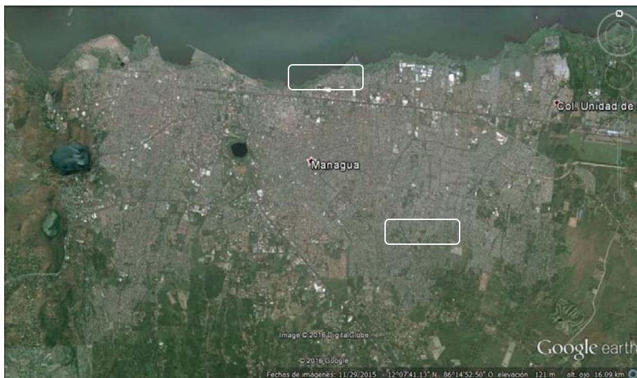
Imagen 1. Ciudad de Managua.

Esto en parte debido a que el gobierno local ya no administra totalmente el territorio urbano para el conjunto de habitantes y se observa una desvinculación entre estos actores. La reagrupación de los individuos en espacios adecuados de manera exclusiva para conformar unidades urbanas de distintos tipos, refleja la ausencia de una visión de la sociedad urbana como un todo y al contrario da paso a que las desigualdades cada vez sean más marcadas y perceptibles.