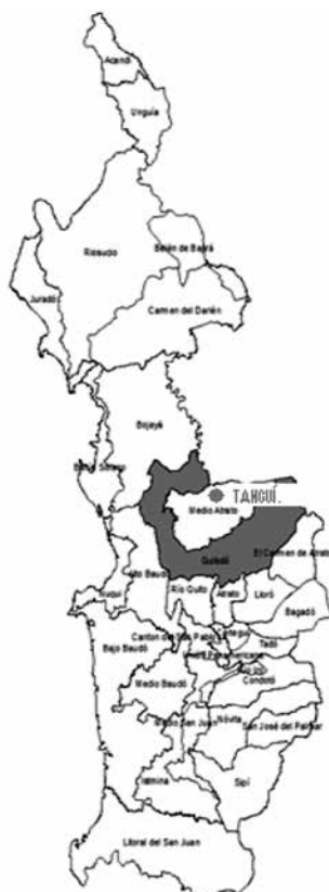
Ubicación del corregimiento de Tanguí-Chocó (Colombia)