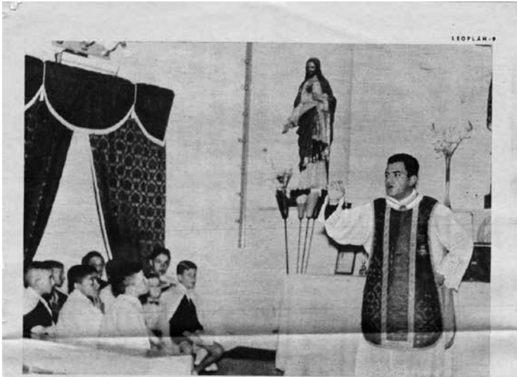
El padre diciendo misa. Antes concurrían 150 personas; ahora lo hacen 400 y hasta 500 y espera que pronto vayan 700.