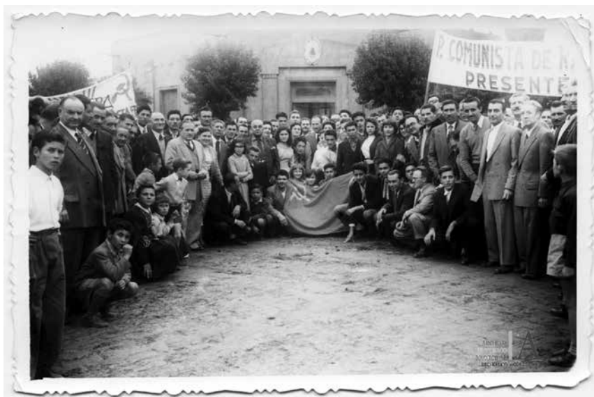
Foto 6 del festejo por el triunfo del Partido Comunista.

En la siguiente imagen se puede observar el apoyo popular a la fórmula ganadora, en ella se ve a una multitud reunida frente a la casa de gobierno, con la bandera roja, la hoz y el martillo.