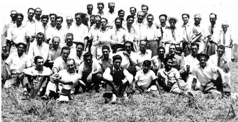
Foto 7 de la conmemoración del aniversario de la URSS.

En la siguiente imagen de la conmemoración del aniversario de la Unión de Repúblicas Socialistas Soviéticas [URSS] se puede apreciar la diversidad de los militantes comunistas locales, por su vestimenta, se observa la presencia de obreros de fábrica y de trabajadores rurales.