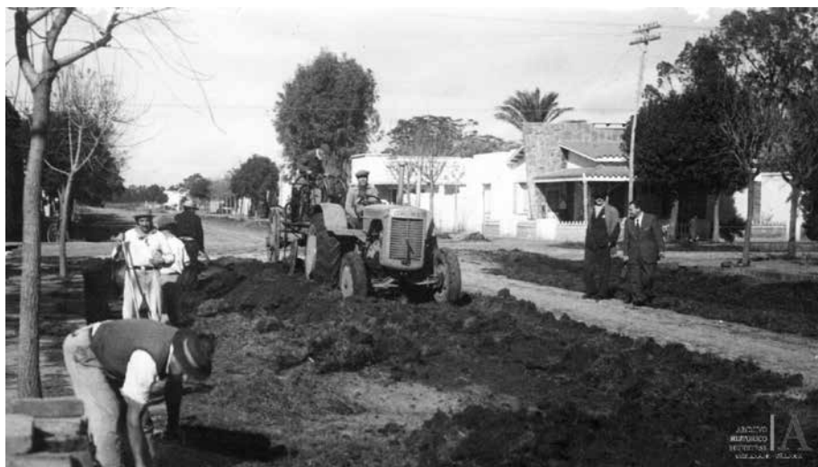
Foto 8 Félix Stradella observando obras de arreglo de calles.