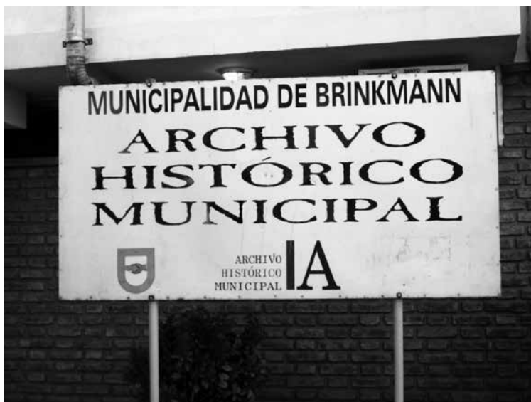
Foto 12 del Archivo Municipal de Brinkmann, 2018. Fotografía de Mariana Mastrángelo.