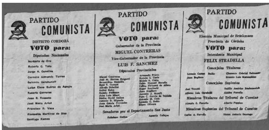
Foto 5 de la boleta del Partido Comunista a nivel provincial y comunal.

En la siguiente imagen se puede observar el apoyo popular a la fórmula ganadora, en ella se ve a una multitud reunida frente a la casa de gobierno, con la bandera roja, la hoz y el martillo.