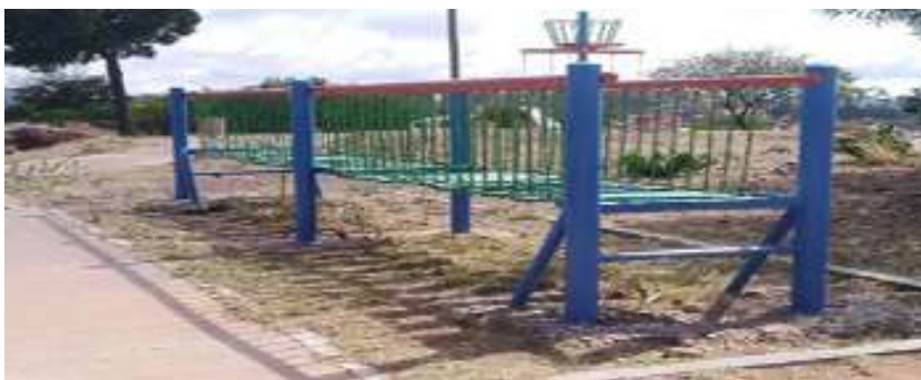
Imagen 6 Seguridad Parque Libertadores