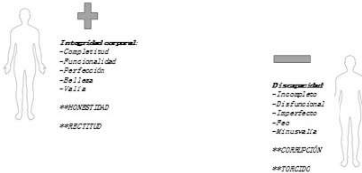
Ilustración 2. La figuración del manco corrupto / Descripción: del lado izquierdo la silueta de un cuerpo “con manos” (+) Integridad corporal: completitud, funcionalidad, belleza, perfección, valía, HONESTIDAD, RECTITUD. Del lado derecho la silueta de un cuerpo “sin manos” discapacidad: incompleto, disfuncional, imperfecto, feo, minusvalía, CORRUPCIÓN, TORCIDO.

Asimismo, parafraseando a Teresa de Lauretis, la discapacidad (en singularidad con el género) no solo es “el efecto de la representación sino también su exceso, lo que permanece fuera del discurso como trauma potencial que, si no se le contiene, puede romper o desestabilizar cualquier representación” (1989: 9); por esto, el concepto del sujeto con discapacidad reside en una realidad material precarizada que se entrelaza con las prácticas representacionales, es decir, la figuración del manco corrupto no se queda en un registro meramente “mental” o “simbólico”, sino que es un efecto semiótico-material que produce al sujeto en un línea de fuga que revela el vínculo anímico de la estratificación social.