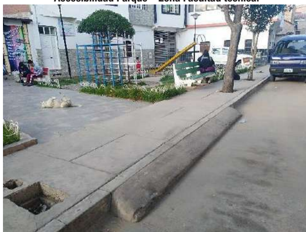
Imagen 7 Accesibilidad Parque – Zona Facultad técnica.