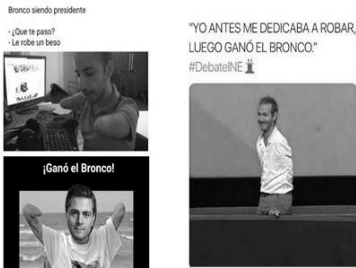
Ilustración 1. Memes de mancos / Descripción: imagen superior izquierdo “una persona 'sin manos' frente a un monitor de computadora y un teclado, arriba un diálogo ‘Bronco siendo presidente. - ¿Qué te pasó?, - Le robé un beso’”; imagen inferior izquierdo “El rostro del expresidente Enrique Peña Nieto montado sobre un cuerpo “sin manos”, arriba la frase ¡Ganó el bronco!”; imagen derecha “Nick Vujicic impartiendo una de sus conferencias. Arriba el texto ‘Yo antes me dedicaba a robar, luego ganó el bronco. #DebateINE’”.

Lo que quiero señalar con esta escena es que la discapacidad no apareció en el marco de la democracia y el pluralismo, sino ante todo como cuerpos que sirven para instrumentalizar una metáfora de la descomposición, la perversión o la “lucha contra la corrupción”. La injuria juega con nuestra moral: manco = corrupto / íntegro (“sin discapacidad”-“con manos”) = honesto . Melania Moscoso (2013) recuerda que la representación de la discapacidad está vinculada siempre a un aleccionamiento moral, exhibiéndola en modelamientos de subjetivación colocados en la ambivalencia del castigo o la inspiración.