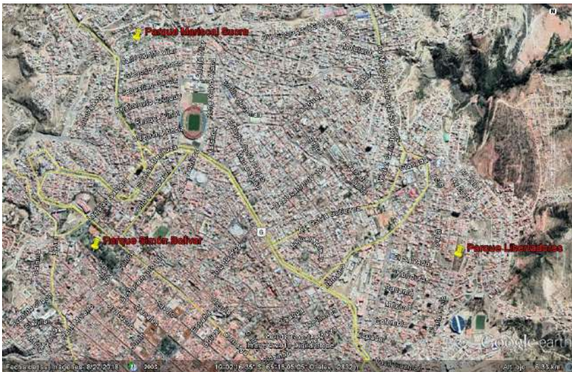
Imagen 2. Ubicación geográfica de muestras de investigación: parques urbanos y parques infantiles en la ciudad de Sucre