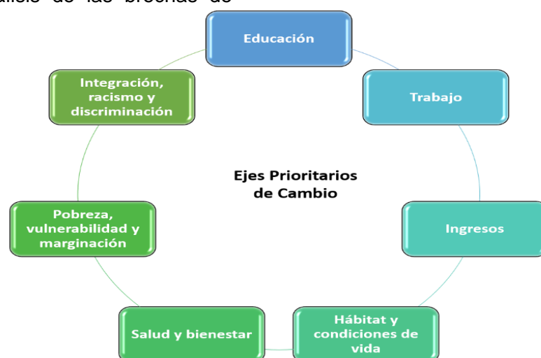
Figura 1. Propuesta de ejes prioritarios de cambio para la superación de brechas de equidad racializadas.

equidad racializadas en su multidimensionalidad e interseccionalidad, en las que habría que intervenir al unísono para producir una modificación sustantiva en la situación de la población no blanca (Fig.).