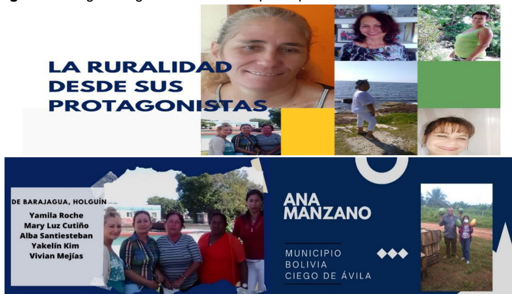
Figura 4. Infografías generadas con las participantes del Seminario. Primer Taller