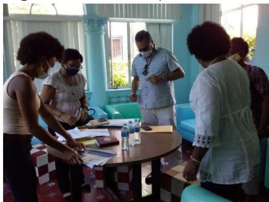
Figura 2. Taller con experto/as. Análisis prospectivo de vulnerabilidades y mujeres negras.