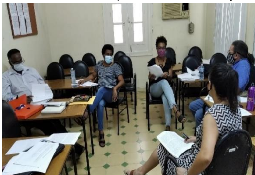
Figura 3. Taller con experto/as. Análisis prospectivo de vulnerabilidades y mujeres negras.

Economía Cubana, el Instituto Cubano de Investigaciones Culturales “Juan Marinello”, el Instituto Nacional de Higiene y Epidemiología, el equipo de coordinación de la Comisión Nacional del Programa de Lucha contra el Racismo “José Antonio Aponte”, la Fundación Nicolás Guillén, la Casa de las Américas, el Grupo para el Desarrollo Integral de la Capital, el Capítulo Cubano de la Red de Mujeres Afrolatinoamericanas, Afrocaribeñas y de la Diáspora, la Cátedra Caribe y la Unión Nacional de Escritores y Artistas de Cuba.