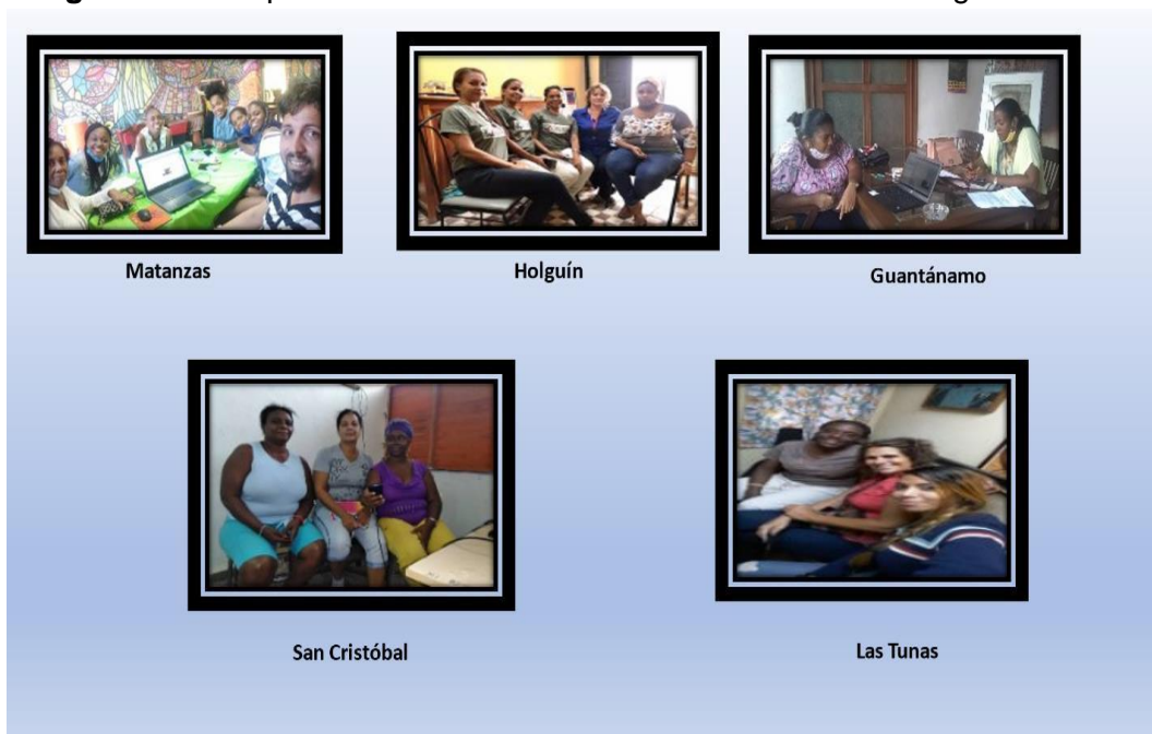
Figura 5. Participantes en el Seminario de Políticas Sociales. Segundo Taller.