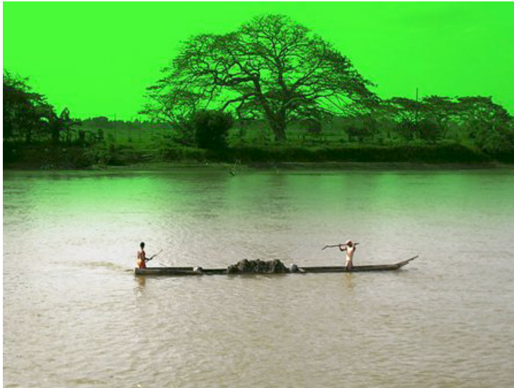
Río Sinú, Departamento de Córdoba, Colombia.