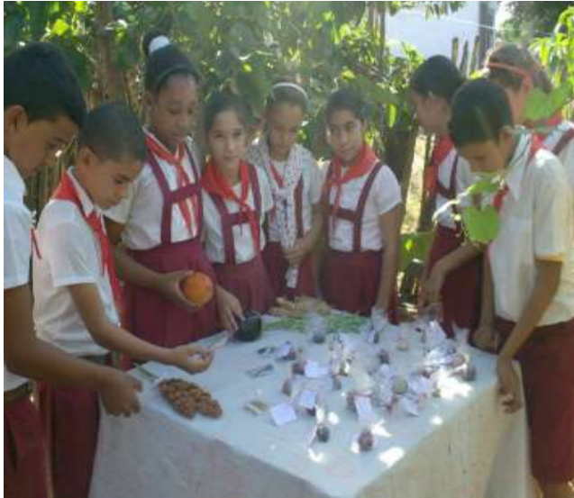
Fig. 3 Niños y niñas del Grupo Comunitario de Permacultura de Banao, provincia Sancti Spíritus.