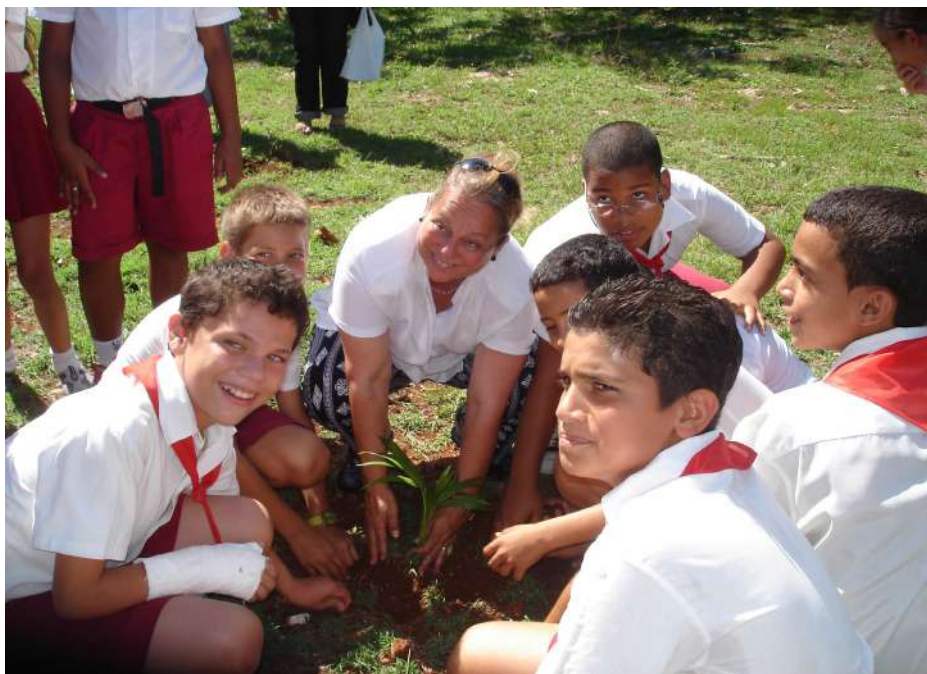
Figs. 4 y 5 Grupo de mapeadores de la escuela primaria Panchito Gómez Toro de Alamar, municipio Habana del Este en la reforestación (a) y actividad cultural de inauguración del paseo con sombra (b).