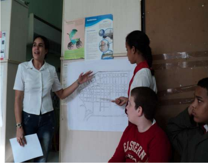
Figs. 1 y 2 Taller de Mapa Verde