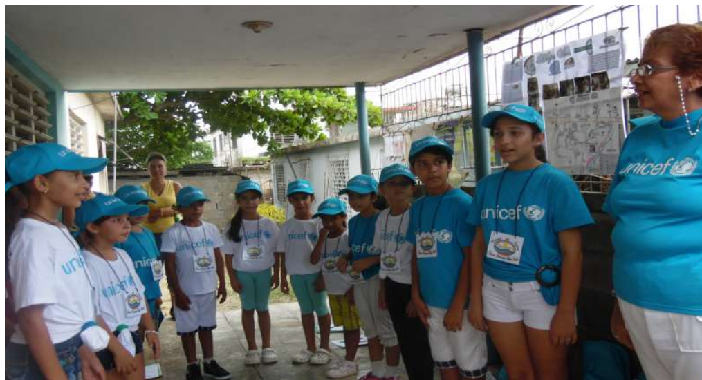
Fig. 3 Grupo de mapeadores de la escuela Paquito González, del nodo de Consolación del Sur, realizando dibujos para colocar en su Mapa Verde.