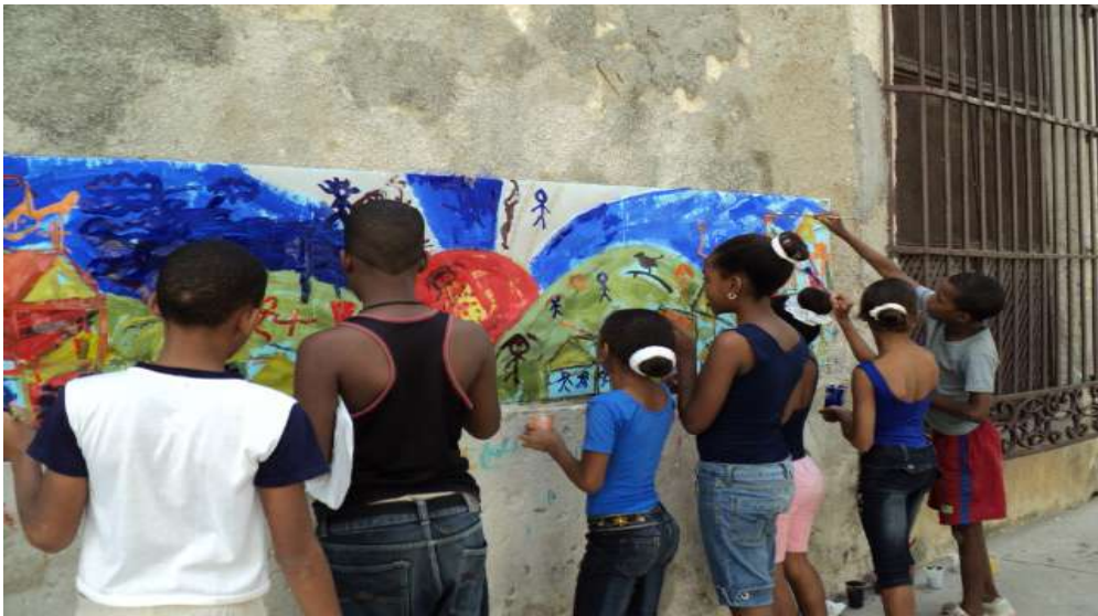
Fig. 3 Niñas y niños de Jesús María, asesorados por artistas plásticos del grupo Espiral, pintan las paredes de la comunidad.

Los artistas del grupo Espiral se sensibilizaron con la problemática social y ambiental del barrio Jesús María, realizaron un proceso de estudio de la iconografía que se utiliza para graficar los sitios verdes, visitaron algunos de los sitios verdes, unos arruinados, otros con menos dificultades y algunos en proceso de recuperación, pero todos importantes y emblemáticos de la comunidad.