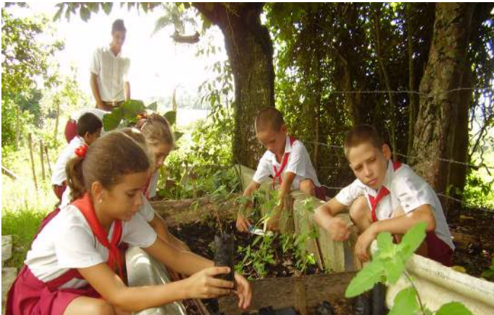
Fig. 10 Infantes de la escuela Rafael Morales, La Vigía, San Diego de los Baños, en trabajos de mantenimiento del vivero de la escuela.

Cada acción está avalada por un conocimiento previo, igual sucede con la creación de huertos en las escuelas; ello responde a una necesidad de abastecer a los comedores escolares con insumos y condimentos. Esto es más evidente en zonas rurales. Tenemos evidencias en La Vigía, Los Palacios y Consolación del Sur, en la provincia de Pinar del Río, Cumanayagua, en la provincia de Cienfuegos, en el municipio Holguín, de la provincia del mismo nombre, y en Bolivia, provincia de Ciego de Ávila, donde los grupos de las escuelas han creado y atienden sus huertos.