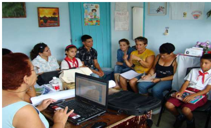
Fig. 13 Grupo coordinador del nodo de La Vigía, San Diego de los Baños, Pinar del Río, integrado por infantes y adultos.

En el nodo de San Cristóbal, Artemisa, el preuniversitario José Licourt Domínguez, anualmente participa en el evento comunitario: ¿Cómo realizo Educación Ambiental (CREA)? donde los estudiantes son parte activa de un espacio destinado a MV, con una temática diferente cada vez. Estos adolescentes habilitan el local, montan exposiciones con sus mapas y exponen a quienes los visitan sus logros. Aunque la figura de sus profesores les sirve de apoyo, el traslado a la comunidad que se elija para realizarlo por los coordinadores, los medios para mostrar su trabajo, corren a cargo de ellos, lo que denota compromiso y nivel de decisión.