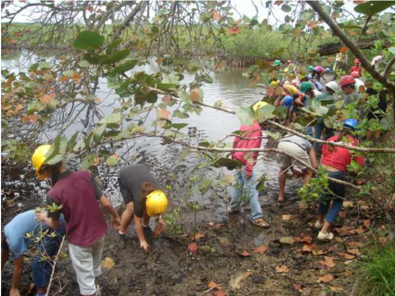
Fig. 12 Infantes del proyecto Ecoarte de Moa, Holguín, en acciones de reforestación

En La Vigía, San Diego de los Baños, Pinar del Río, el nodo que radica en la escuela rural Rafael Morales, integran su grupo coordinador escolares, docentes, madres y otros actores de la comunidad, todos con el derecho a opinar, proponer y participar en las decisiones que se toman.