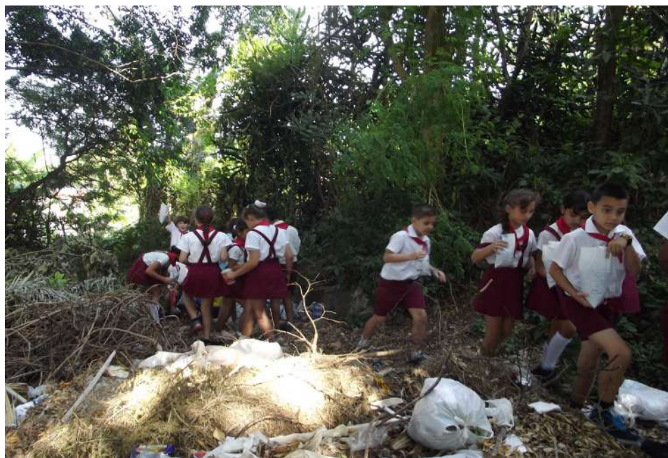
Fig. 8 Infantes de la escuela primaria Ernesto Aranguren, Guanabo, Municipio Habana del Este, colectando la tierra para la preparación de un semillero en su escuela.

La experiencia de promotores y el levantamiento de vulnerabilidades ha orientado el trabajo de los grupos de los centros docentes hacia pequeñas transformaciones cercanas a su entorno escolar, las que tributan al enfrentamiento al CC. Conocer sus causas y consecuencias también ha contribuido a que los grupos de mapeadores infantiles se incorporen a las labores de saneamiento comunitario que tanto incide en los barrios, a actividades de mejoramiento ambiental como los estudiantes de la escuela primaria Ernesto Aranguren, de Guanabo, donde sus grupos de MV luego de informados, se sumaron a la campaña de forestación de la playa, confeccionando semilleros de plantas autóctonas en la escuela y en sus casas para luego ser trasplantadas a una parcela experimental en la playa. Ellos las colocaron en bolsitas plásticas de yogurt que recuperaron, llenaron de tierra, colocaron la planta y luego regaron y cuidaron. La escasez de agua para regadío obligó a que fueran llevadas a sus casas para su atención y luego trasplante.