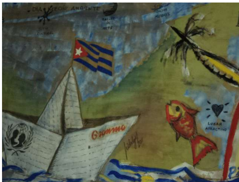
Fig. 4 Pintura mural, donde se reflejan íconos de Mapa Verde.