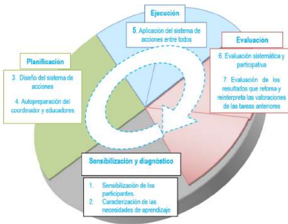
Fig. 1. Representación gráfica de las etapas y tareas

En las investigaciones de la escuela especial Dora Alonso, entre el 2007 y el 2014, se desarrolló una estrategia de educación familiar para las familias de los niños con autismo. Surgió del reclamo de los padres y familiares para contribuir de manera exitosa a la educación de sus niños (Campo, 2012). A continuación, se explican las principales tareas de la estrategia (ver Figura 1). Se compone de cuatro etapas: diagnóstico, planificación, ejecución y evaluación. En cada una se realizan tareas entre las familias y los docentes o especialistas, en función de las necesidades de los participantes. Estas fases funcionan como una espiral dialéctica que se enriquece progresivamente.