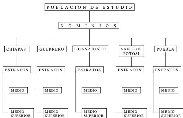
Desagregación de la población de estudio

El estrato medio se formó por los y las estudiantes de las escuelas secundarias y telesecundarias. El estrato medio superior quedó conformado por los y las estudiantes de las escuelas de bachillerato. 3