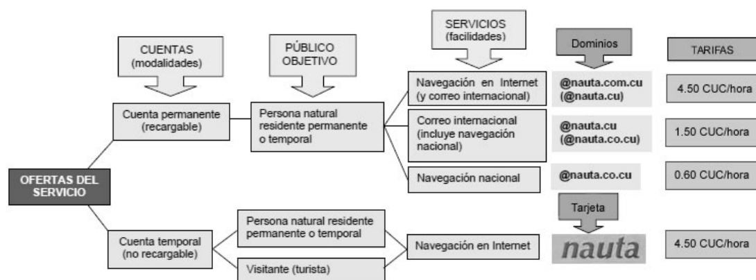
Gráfico 2. Servicio Nauta. ETECSA

A finales de agosto de 2013 en todo el país solo alrededor de 100 mil personas habían hecho contratos con ETECSA para utilizar los servicios de Nauta, habían comprado sus