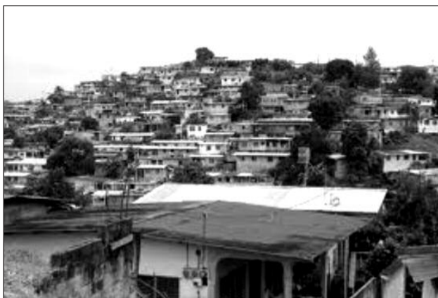
Fotografía 3 Tugurios urbanos (centro de la ciudad)