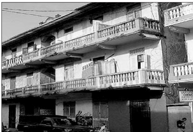
Fotografía 2 "Casas condenadas" (Panamá centro)