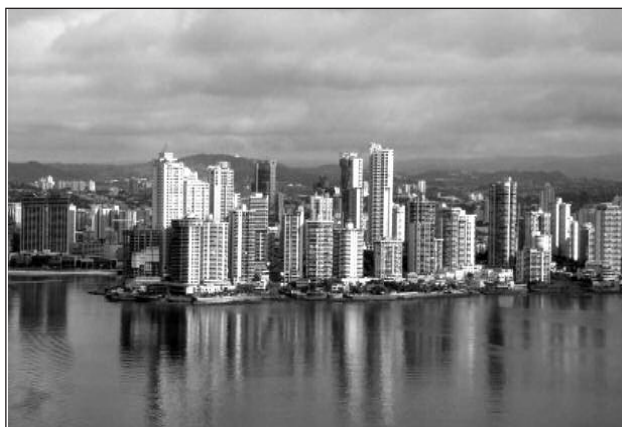
Fotografía 4 Área bancaria, comercial y de servicios de Punta Paitilla (centro urbano)

ciamos desde inicios de la década del noventa, responsable del skyline urbano que hoy caracteriza a la ciudad (ver fotografía 4). El impulso de este boom estuvo ambientado y favorecido, adicionalmente, por las medidas de ajuste estructural que se desarrollaron entre 1983 y 1999 para favorecer al sector. Para el año 2000, esto significó una agresiva construcción de edificios altos y centros comerciales exclusivos en el centro financiero, comercial y de servicio localizado en el corazón urbano de la ciudad (corregimientos de Bella Vista y San Francisco), así como hacia terrenos de la costa este de la ciudad. Este proceso se dio sin un plan de zonificación que indicara los valores catastrales de los terrenos y sus bienes patrimoniales, ni tampoco un marco legal coherente que hiciera frente a la rápida ocupación del suelo en esas áreas.